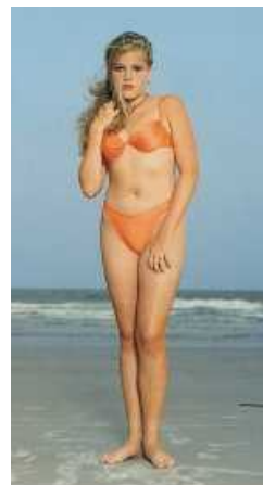
LÁGRIMAS de EROS

La relación entre el deseo y la muerte –Eros y Tánatos– en las artes visuales es el tema de esta exposición, con más de un centenar de obras entre pinturas, esculturas, fotografías y vídeos.